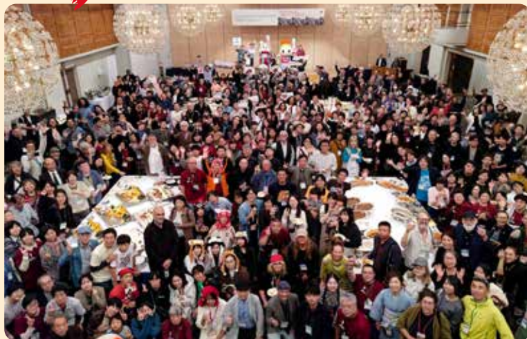
10月15日[水] さよならパーティー

山形国際ドキュメンタリー映画祭2025が、10月16日に無事閉幕いたしました。国内外から26,000人を超える多くの観客の皆様、監督・審査員等ゲストの皆様、映画関係者の皆様にご参加いただきました。メイン会場の中央公民館ホールをはじめ、今年は各会場、ホールが大勢のお客様で賑わい、さまざまな言語が飛び交う国際映画祭らしい活気あふれる一週間となりました。