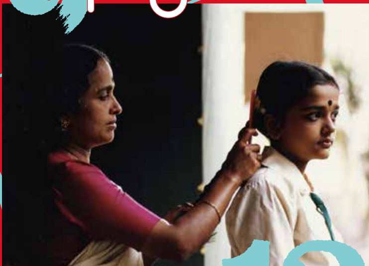
『井戸の上の眼』(12月12日 金曜上映会)