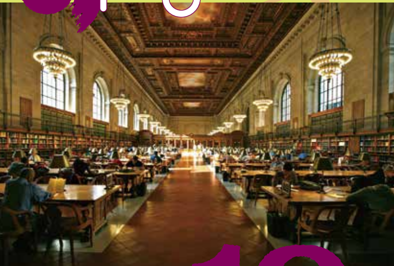
【ニューヨーク公共図書館 エクス・リプリス】 10.13 遊学館ホール「未来をつくる人と場」

YIDFF 2025プレイベント ×山形県立図書館オータムフェスタ 未来をつくる人と場