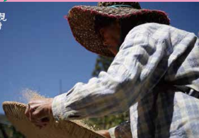
「テラキスの帰郷」2.17金曜上映会出張版