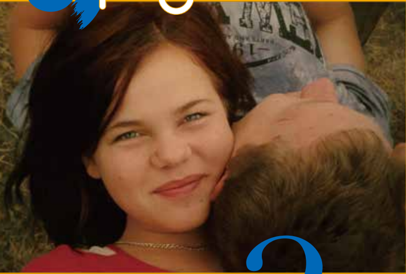
『トランスニストラ』2.14 金曜上映会