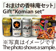
※写真はイメージです The photo shows a sample.

YIDFF 公式ショップ YIDFF Official Shop https://yidff.theshop.jp/